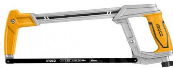
HHF3088 Arco Sierra Mecánico 300 mm