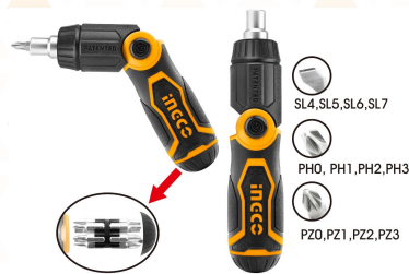
AKISD1208 Destornillador Juego 13 en 1