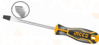
HGTS286100 Destornillador Plano 6 mm largo 100 mm