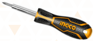
AKISD0608 Set Destornilladores 6 en 1