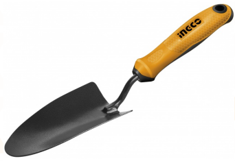
HFTT858 Palita transplante