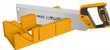
HMBS3008 Serrucho costilla con guía de corte 300 mm