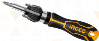
AKISD0808 Destornillador Juego 8 puntas