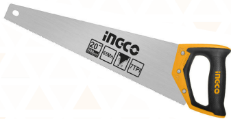
HHAS28500 Sierra de mano 20"