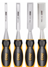
HKTWC0401 Set de 4 formones para madera