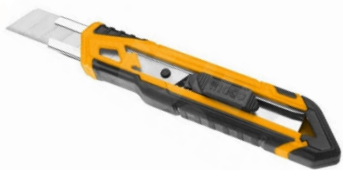
HKNS16518 Cutter retráctil 18 mm