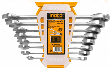
HKSPAR1082 Juego llaves crique combinadas 8 piezas