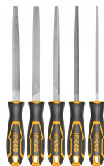
HCC0841016 Set limas de acero 5 piezas