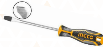
HGTS286150 Destornillador Plano 6 mm largo 150 mm