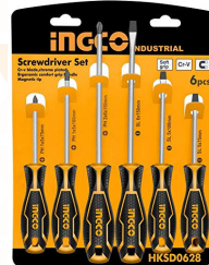
HKSD0628 Set destornilladores 6 piezas