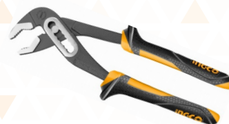
HPP28250 Alicate Pico de Loro 10'