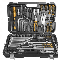
HKTHP21421 Set herramientas combinadas 142 piezas